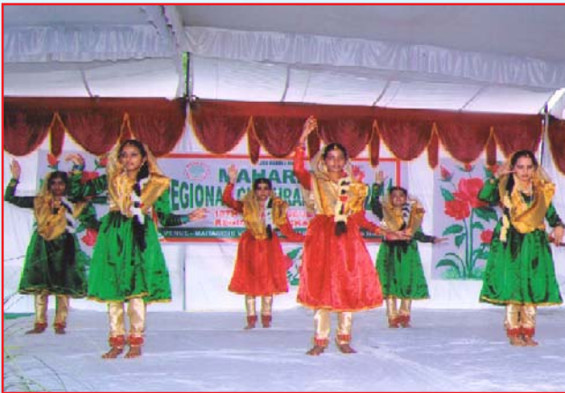
Students of M.V.M Dharamshala Participated in Senior Dance Competition in Regional Culture Meet held at Jagadhari (Yamuna Nagar) and got 2 nd position .