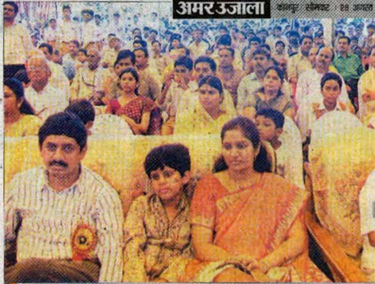
सांस्कृतिक कार्यक्रम के भाग लेते जिलाधिकारी।