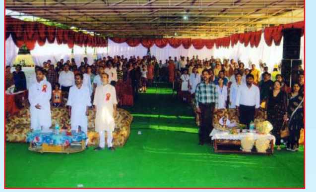
क्षेत्रीय सांस्कृतिक महोत्सव के अवसर पर उपस्थित जनसमूह।