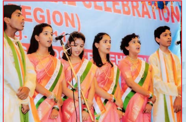
क्षेत्रीय सांस्कृतिक महोत्सव के अवसर पर सामूहिक गान प्रस्तुत करते हुये महर्षि विद्या मन्दिर के छात्र-छात्रायें।