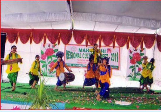
क्षेत्रीय सांस्कृतिक महोत्सव के अवसर पर समूह नृत्य प्रस्तुत करते हुये महर्षि विद्या मन्दिर के छात्र-छात्रायें।