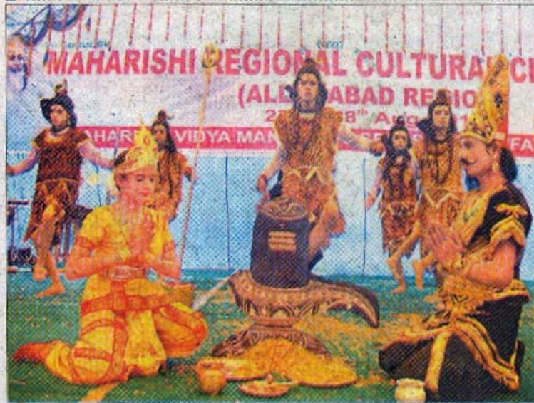
महर्षि विद्या मंदिर स्कूल में रंगारंग कार्यक्रम धारा करते बच्चे।