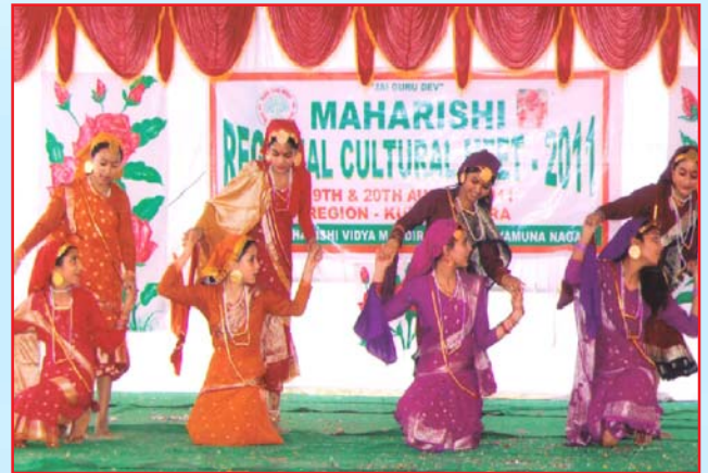
Students of M.V.M Dharamshala Participated in Senior Dance Competition in Regional Culture Meet held at Jagadhari (Yamuna Nagar) .