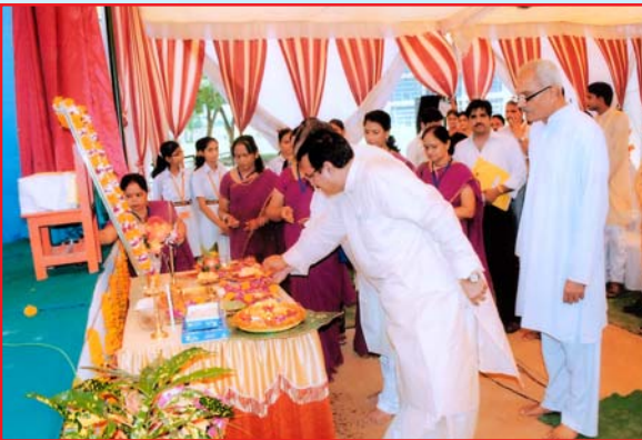
क्षेत्रीय सांस्कृतिक महोत्सव के अवसर पर गुरुपूजन करते हुये महर्षि विद्या मन्दिर समूह के पदाधिकारीगण, शिक्षक एवं छात्र।