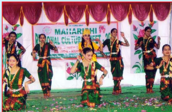
क्षेत्रीय सांस्कृतिक महोत्सव के अवसर पर समूह नृत्य प्रस्तुत करते हुये महर्षि विद्या मन्दिर के छात्र।

विज्ञान प्रदर्शनी के वरिष्ठ वर्ग में महर्षि विद्या मंदिर कठुआ ने प्रथम स्थान लेकर प्रतियोगिता जीत ली। कनिष्ठ वर्ग में महर्षि विद्या मंदिर जगाधरी प्रथम रहा। गणित प्रदर्शनी के वरिष्ठ वर्ग में महर्षि विद्या मंदिर अम्बाला प्रथम स्थान पर रहा। कनिष्ठ वर्ग में महर्षि विद्या मन्दिर जगाधरी ने प्रथम स्थान प्राप्त किया।