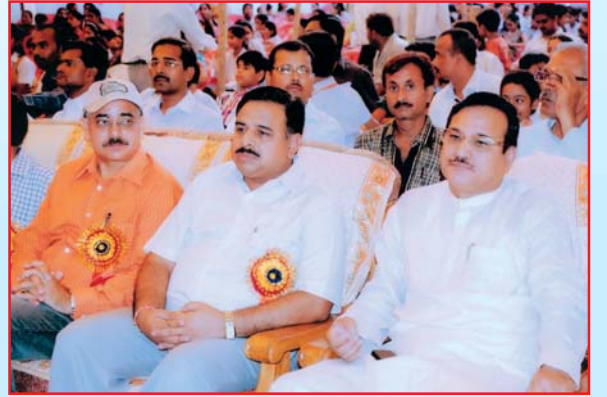
क्षेत्रीय सांस्कृतिक महोत्सव के अवसर पर उपस्थित माननीय जिलाधीश फतेहपुर, चीफ जूडिशियल मजिस्ट्रेट फतेहपुर एवं निदेशक मण्डल के पदाधिकारी एवं गणमान्य नागरिकगण।