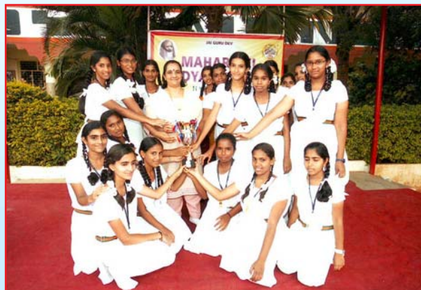
Student of MVM Hyderabad with winner's trophy in Inter School Throw Ball Tournament.

After 3 rounds of tough competition, MVM, Hyderabad entered in the finals with D. A.V. Public School. In the final set, MVM, Hyderabad decimated D.A.V with their skill, strength and power play. They clinch the title with a score of 25-11 to lift the trophy.