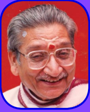
ASHOK SINGHAL Patron, Vishwa Hindu Parishad, International