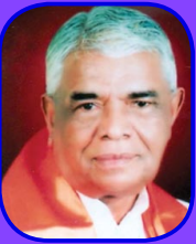
श्री बाबूलाल गौर माननीय मंत्री, नगरीय प्रशासन एवं विकास, मोपाल गैस त्रासन्दी राहत एवं पुनर्वासि विभाग, मध्यप्रदेश शासन

Wishing the celebrations, the magazine and the vision and mission of the Maharishi all success!