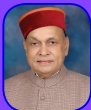
PREM KUMAR DHUPAL Honourable Chief Minister of Himachal Pradesh

I hope that the contents of the Magazine would be immensely useful in getting all the relevant information about the progress and achievements of Maharishi Vidya Mandir Schools Group.