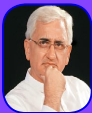
SALMAN KHURSHID Honourable Minister of External Affairs Government of India