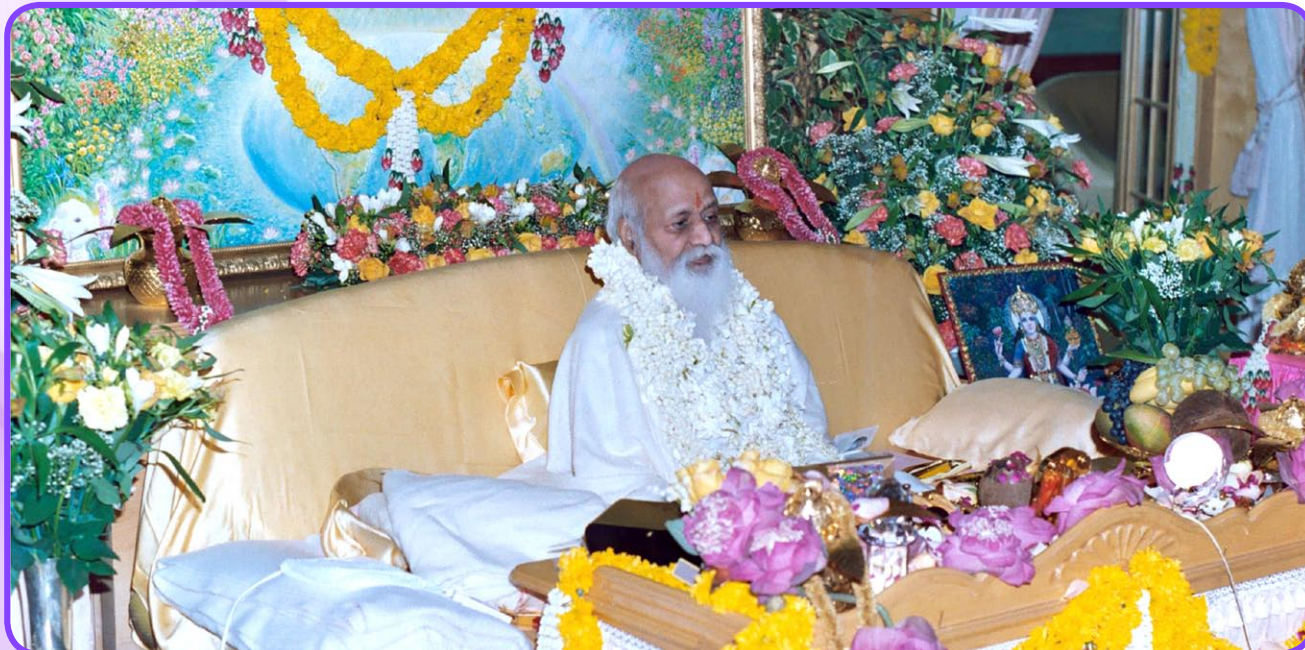
His Holiness Maharishi Mahesh Yogi Ji