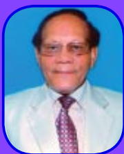
DEVANAND KONWAR His Excellency The Governor of Bihar

I am sure that Maharishi Vidya Mandir will continue to make a significant contribution in educating its students in such a manner that they become strong in character and face future challenges in life boldly and also serve the nation and society as responsible citizens.