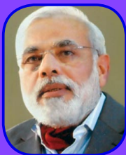
NARENDRA MODI Honourable Chief Minister of Gujarat

It is also heartening to note that 143 branches of Maharishi Vidya Mandir Schools in different states of India including Institutes of Management and colleges are engaged in imparting education to over 100000 students under the aegis of Maharishi Shiksha Sansthan (MSS).