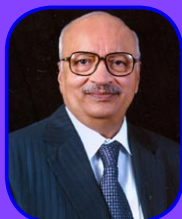
BALMIKI PRASAD SINGH His Excellency The Governor of Sikkim

It is gratifying to note that the main aim of "Maharishi Shiksha Sansthan (MSS)", is to impart most updated knowledge to the students on scientific basis through the technology of Maharishi Vedic Science, which is commendable and indeed the need of the hour. I am sure that MSS will continue to strive hard in inculcating the national spirit and spreading the rich Indian culture and values amongst the students in the years to come.