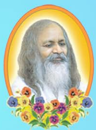
HIS HOLINESS MAHARISHI MAHESH YOGI