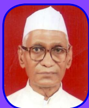
JAGANNATH PAHADIA His Excellency The Governor of Haryana

It is indeed commendable that the aim of the Group is to impart modern education and knowledge to students on scientific basis, along with focus on Indian culture and values.