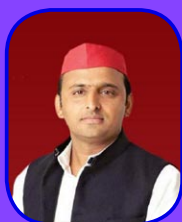
AKHILESH YADAV Honourable Chief Minister of Uttar Pradesh