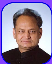
ASHOK GEHLOT Honourable Chief Minister of Rajasthan

I convey my best wishes for celebrations of "Gyan Yug Diwas - The Age of Enlightenment Day" to be observed on birthday of His Holiness Maharishi Mahesh Yogi on 12th January 2013, and also for annual magazine 'Gyan 2013' being published on this occasion.