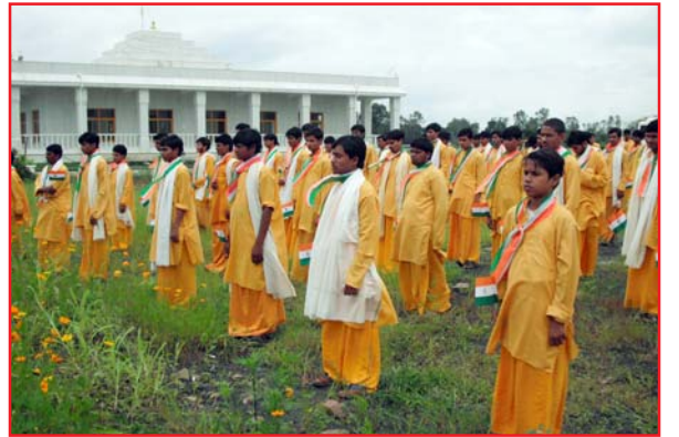
स्वतंत्रता दिवस समारोह के अवसर पर उपस्थित जनसमूह।