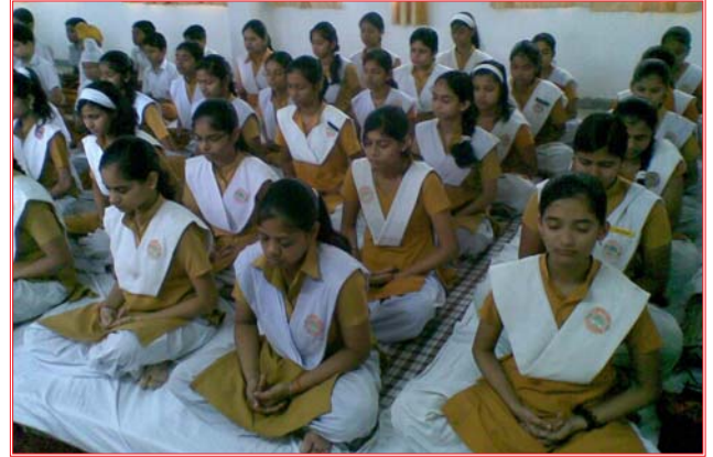
गुरु पूर्णिमा महोत्सव के अवसर पर सामूहिक ध्यान करती हुई, महर्षि विद्या मन्दिर बरेली की छात्रायें।