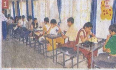
1 इन्होंने मारी बाजी