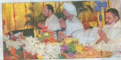
The guests present on the occasion of Guru Purnima celebrated in Maharishi Vidya Mandir, Ratanpur on Friday.