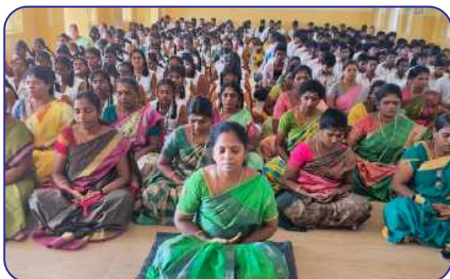
Maharishi Vidya Mandir, Tiruvannamalai

Akshaya Tritiya celebration is presented below through picture gallery: