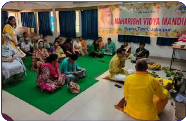
MVM Jabalpur, Napier Town