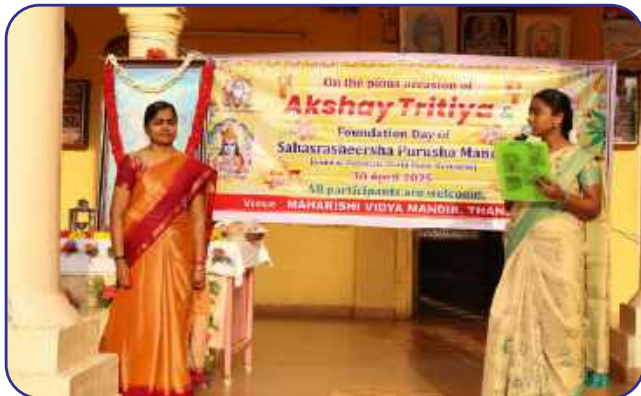
Maharishi Vidya Mandir, Thanjavur