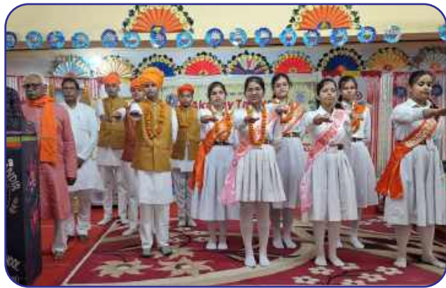
Maharishi Vidya Mandir, Fatehpur