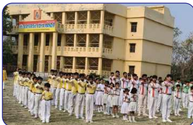
Maharishi Vidya Mandir, Gonda