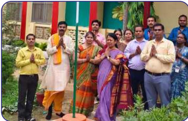
Maharishi Vidya Mandir, Shahdol