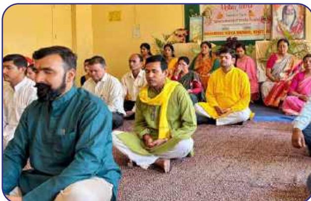
Maharishi Vidya Mandir, Khatima