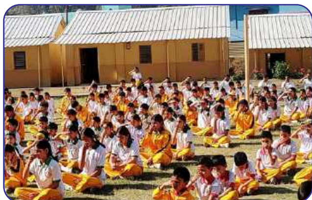
Maharishi Vidya Mandir, Uttarkashi