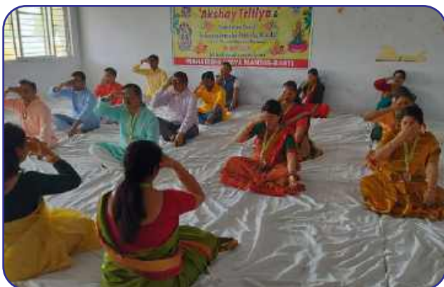
Maharishi Vidya Mandir, Basti