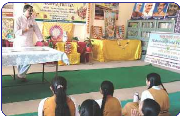
Maharishi Vidya Mandir, Panna