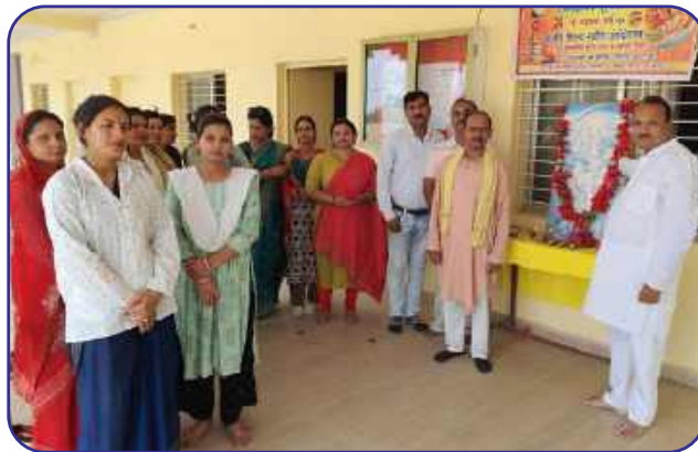
Maharishi Vidya Mandir, Amarpatan