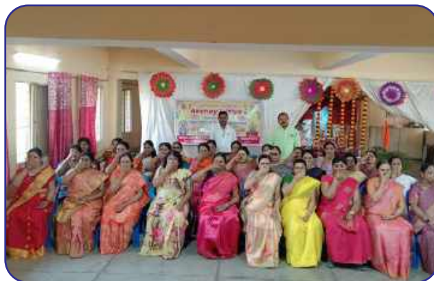
Maharishi Vidya Mandir-I, Raipur