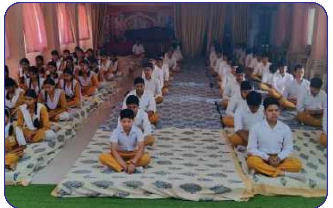
Maharishi Vidya Mandir, Shahdol