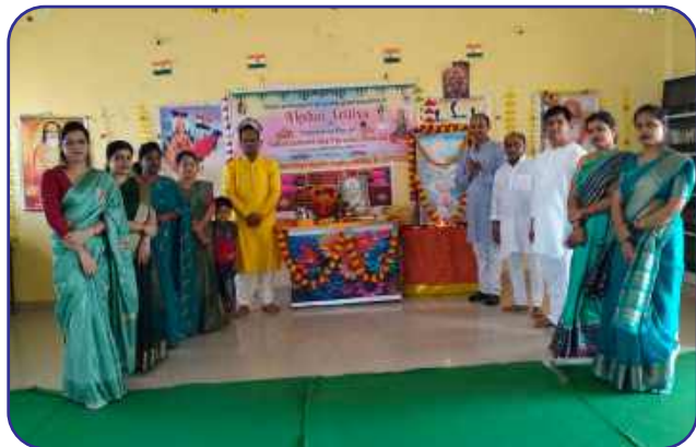
Maharishi Vidya Mandir, Satna