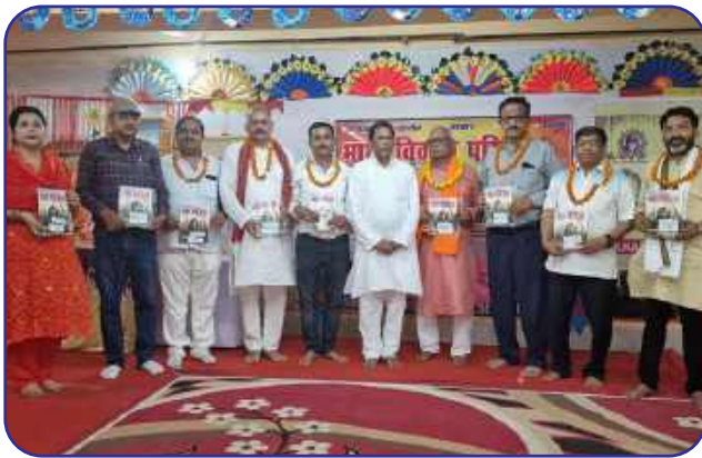
Maharishi Vidya Mandir, Fatehpur