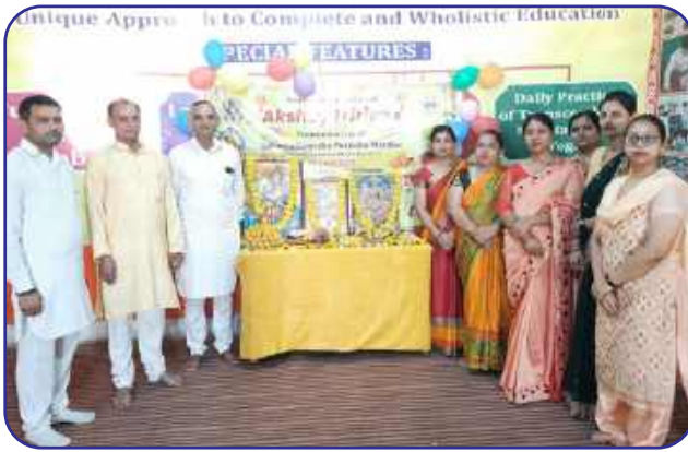
Maharishi Vidya Mandir, Jind