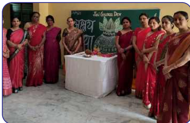
Maharishi Vidya Mandir, Naini Prayagraj