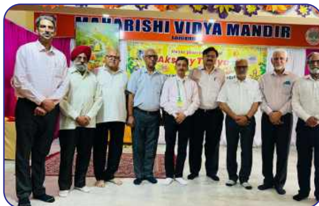
Maharishi Vidya Mandir, Jammu