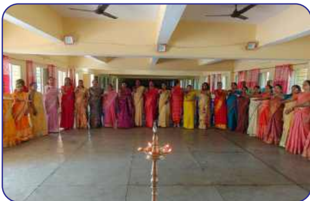
Maharishi Vidya Mandir-I, Raipur