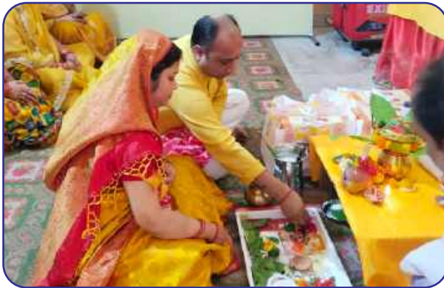
Maharishi Vidya Mandir, Rustampur