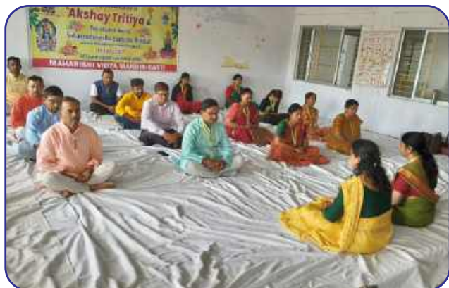
Maharishi Vidya Mandir, Basti