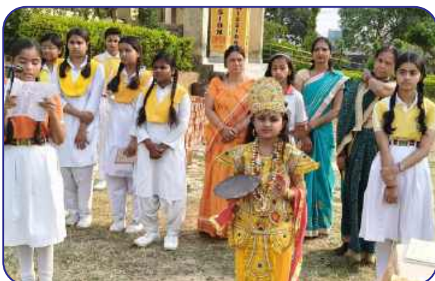
Maharishi Vidya Mandir, Gonda