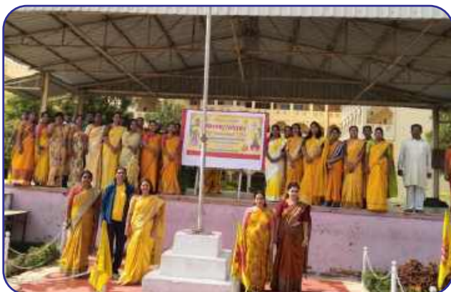
Maharishi Vidya Mandir, Bhandara