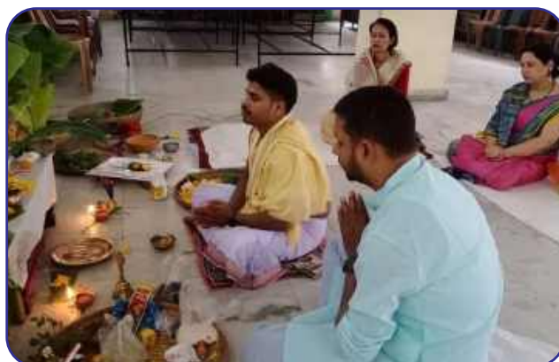
Maharishi Vidya Mandir-III, Guwahati