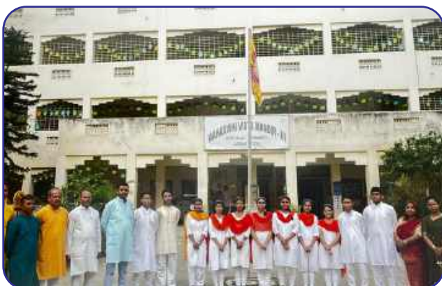
Maharishi Vidya Mandir-III, Guwahati