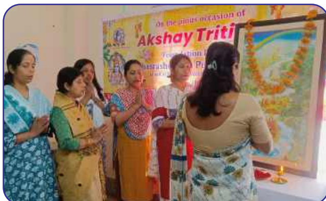
Maharishi Vidya Mandir-VI, Guwahati