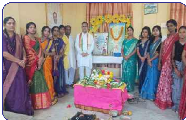
Maharishi Vidya Mandir, Raygada