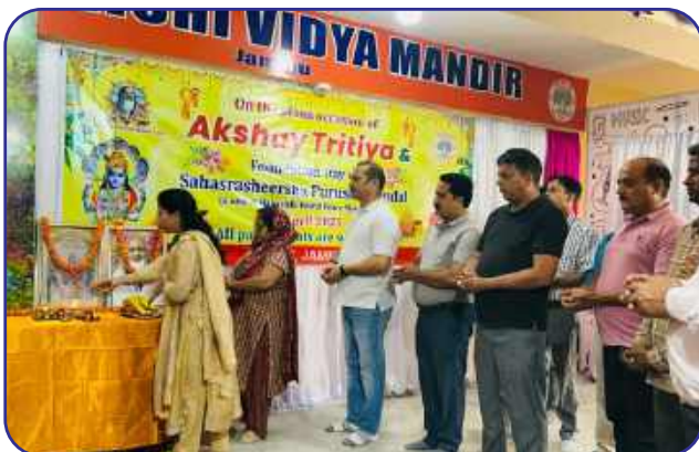
Maharishi Vidya Mandir, Jammu