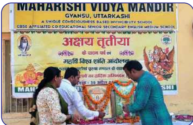
Maharishi Vidya Mandir, Uttarkashi