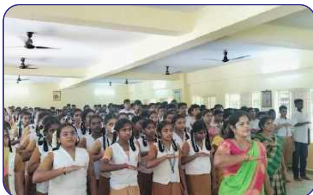
Maharishi Vidya Mandir, Tiruvannamalai