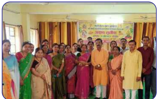
Maharishi Vidya Mandir-VI, Jabalpur