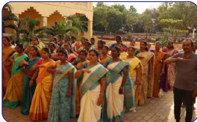
Maharishi Vidya Mandir, Thanjavur