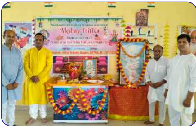
Maharishi Vidya Mandir, Satna