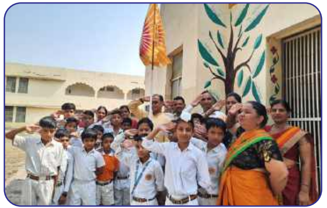
Maharishi Vidya Mandir, Jind