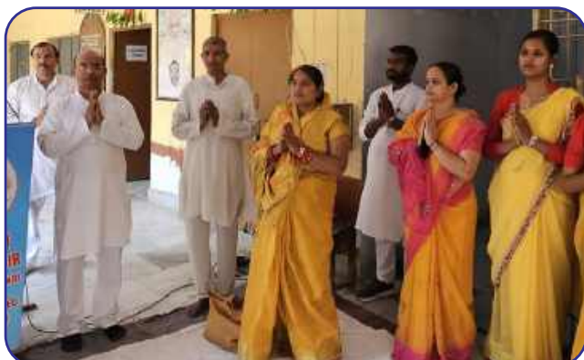
MVM Prayagraj, Junsu