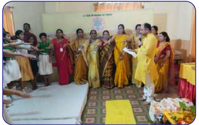
Maharishi Vidya Mandir, Rustampur