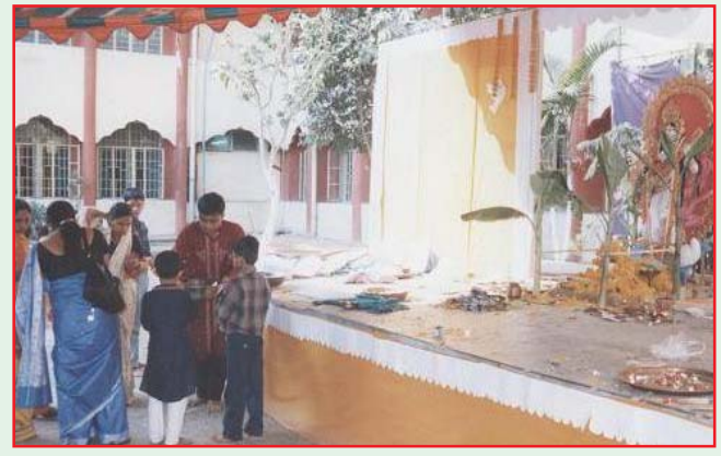
Saraswati Puja was celebrated in the school on 8th February 2011