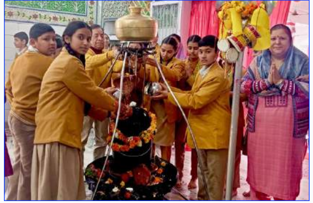
Maharishi Vidya Mandir Jammu