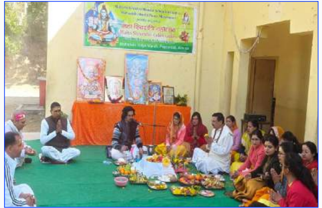
Maharishi Vidya Mandir - I Almora