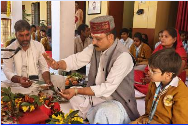
Maharishi Vidya Mandir Prayagraj, Jhansi