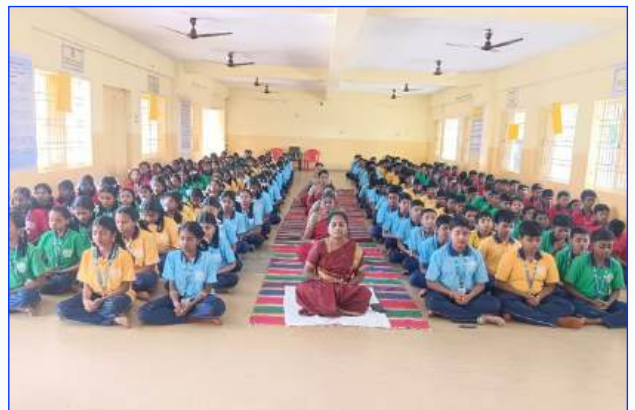
Maharishi Vidya Mandir Tiruvannamalai