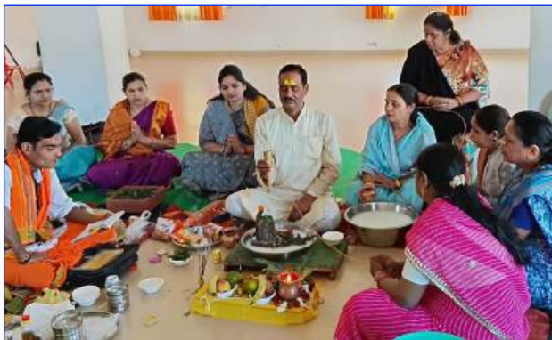
Maharishi Vidya Mandir - III Jabalpur