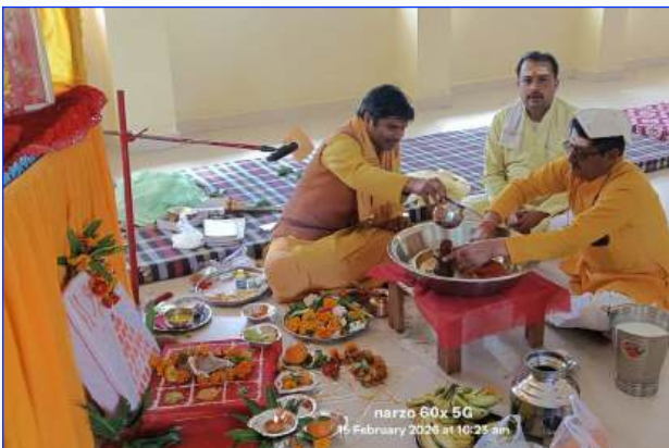
Maharishi Vidya Mandir - II Chhatarpur