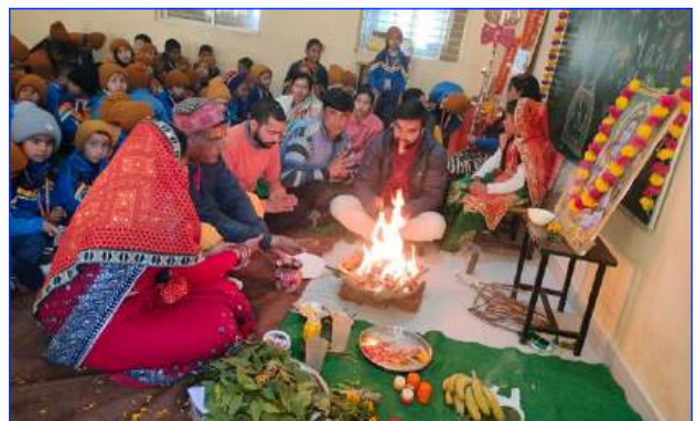
Maharishi Vidya Mandir Nainital