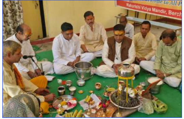
Maharishi Vidya Mandir Shajapur