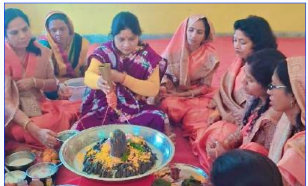
Maharishi Vidya Mandir - IV Jabalpur