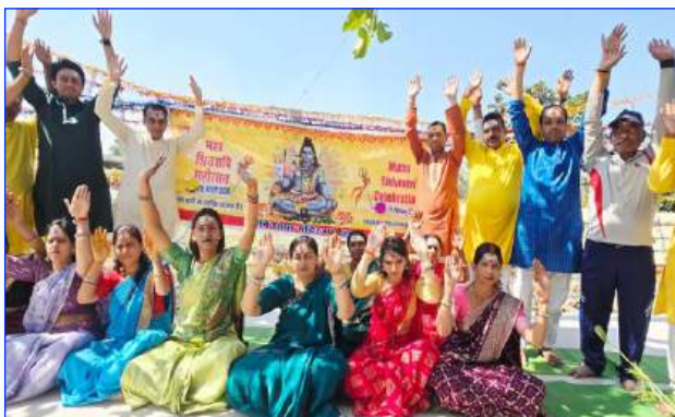
Maharishi Vidya Mandir Mandla