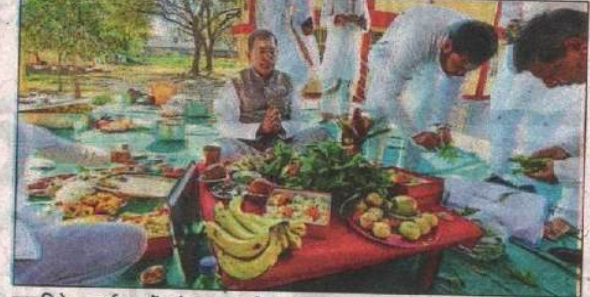
रुद्राभिषेक कार्यक्रम में जुटे प्रधानाचार्य व अन्य।

हिन्दुस्तान www.livehindustan.com अपना फतेहपुर