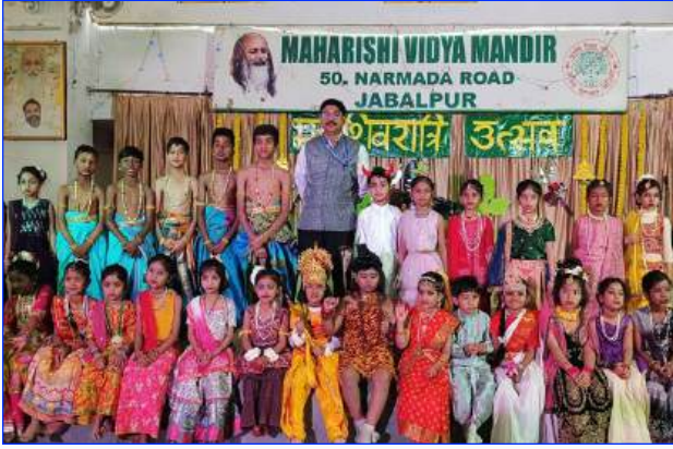
Maharishi Vidya Mandir - I Jabalpur