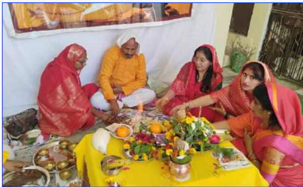
Maharishi Vidya Mandir - III, Chhatarpur

These celebrations at various MVM Schools are depicted through the pictures give below:-