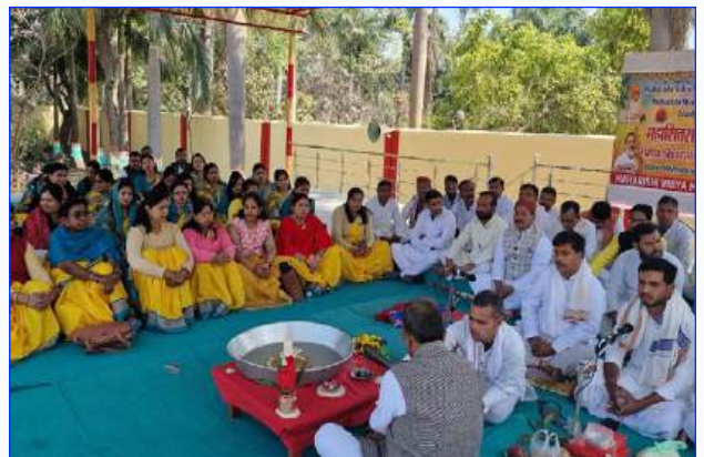
Maharishi Vidya Mandir Fatehpur