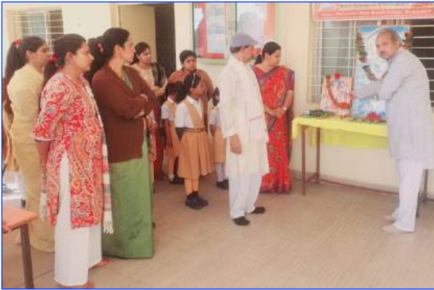
Maharishi Vidya Mandir Amarpatan