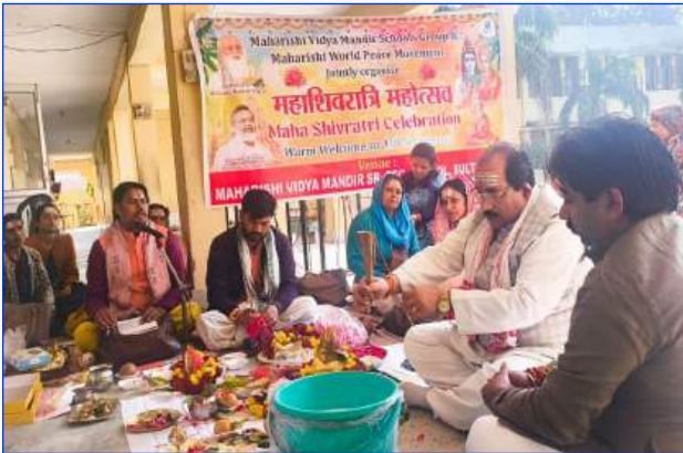
Maharishi Vidya Mandir Sultanpur