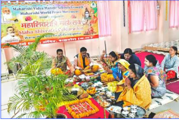
Maharishi Vidya Mandir Shahdol