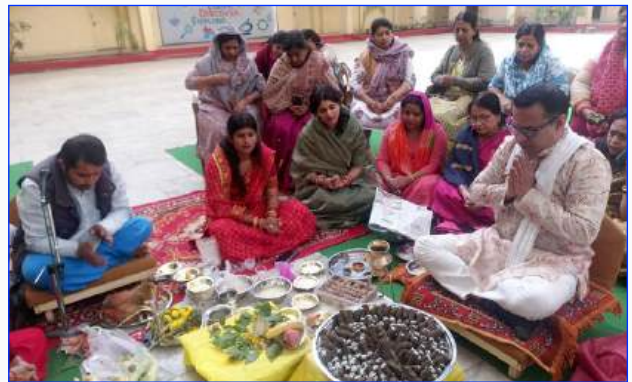
Maharishi Vidya Mandir - II Jabalpur