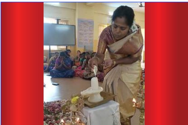
Maharishi Vidya Mandir Tiruvannamalai