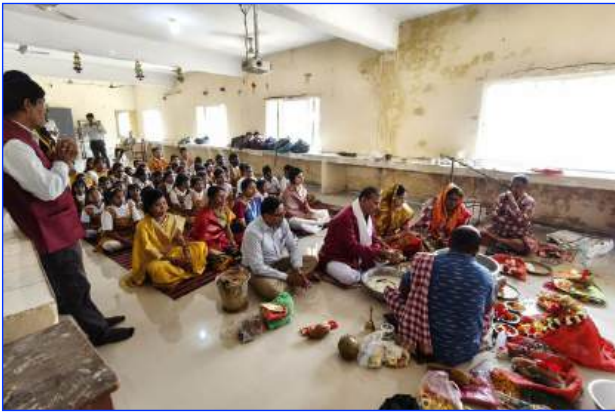
Maharishi Vidya Mandir Balasore