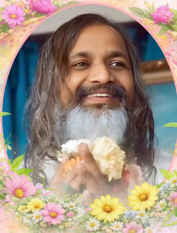
His Holiness Maharishi Mahesh Yogi Ji