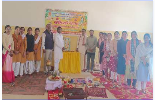
Maharishi Vidya Mandir Banehri