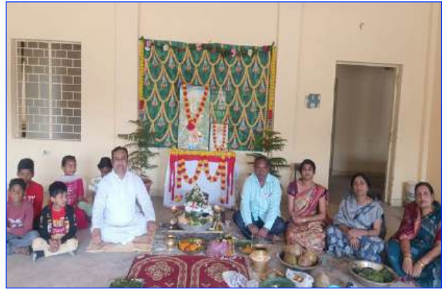
Maharishi Vidya Mandir Rayagada