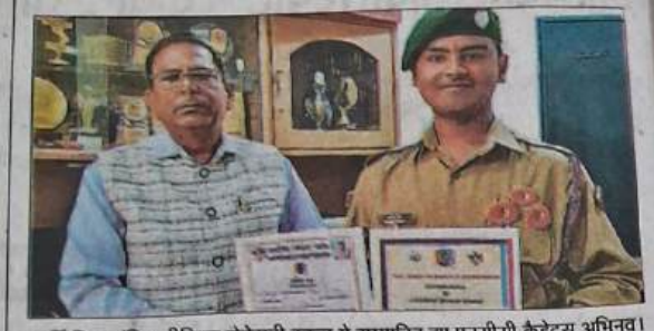
महर्षि विद्या मंदिर सीनियर सेकेण्ड्री स्कूल में सम्मानित हुए एनसीसी कैडेट्स अभिनव।