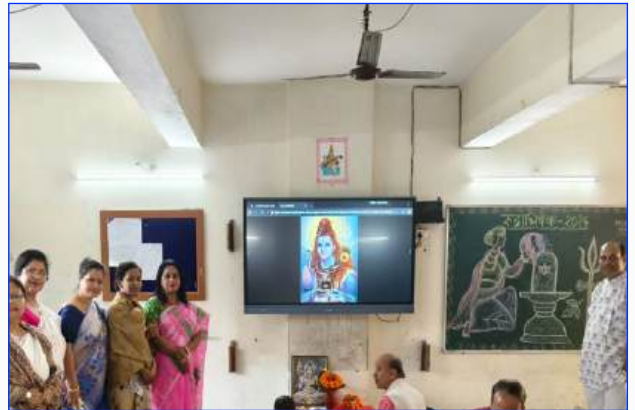
Maharishi Vidya Mandir -III Guwahati